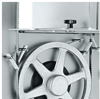
Alimentary plastic blade scraper in quick to insert. Watertight black plastic flange to protect the